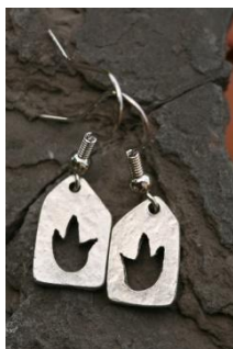
Otisak stope dinosaura (naušnice)